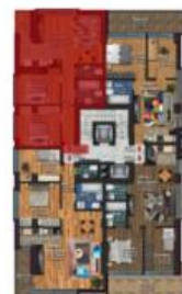
Apartment 3 camere Tip B

Sup. utila: 66.32 mp Sup. terasa: 2.77 mp Sup. construita: 80.61 mp Sup. construita totala: 83.36 mp