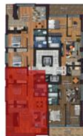
Apartment 3 camere Tip A