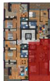
Apartment 3 camere Tip D

Sup. utila: 53.87 mp Sup. terasa: 13.77 mp Sup. construita: 66.47 mp Sup. construita totala: 80.24 mp