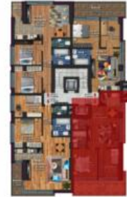
Apartment 3 camere Tip D

Sup. utila: 53.87 mp Sup. terasa: 13.77 mp Sup. construita: 66.47 mp Sup. construita totala: 80.24 mp